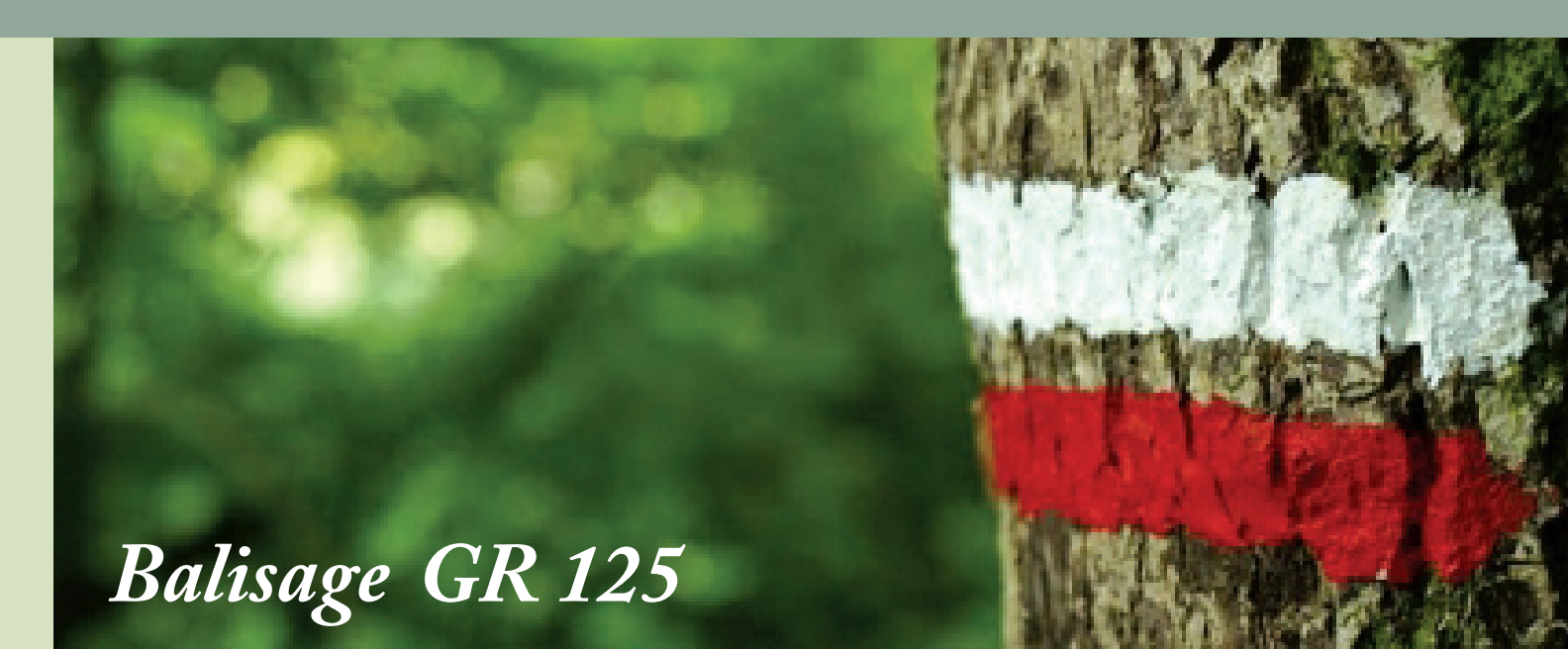
Balisage GR 125

Het vertrek vindt plaats op de Grand Place van Walcourt, met zijn stadswallen en zijn Frère Hugo straatje. De route van 275 km nodigt de wandelaar uit voor boeiende ontdekkingen. Ze trekt snel het platteland in, kronkelt door de venen, passeert de Meren van Eau d'Heure en bereikt Cerfontaine, het geografische hart van het gebied tussen Samber en Maas.