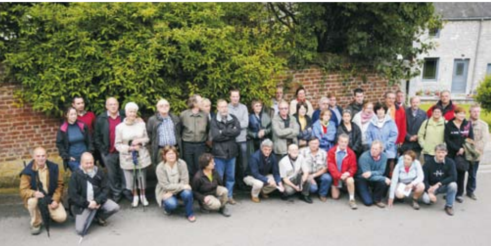
Les bénévoles sentiers des deux GAL réunis à Flavion pour une balade gourmande le 16/06/2012.