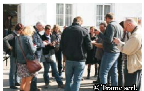
Groupe de travail «Tourismes»: formation GPS en collaboration avec notre GAL

Au travers de réunions de travail réunissant les 15 GAL wallons ou lors de rencontres thématiques impliquant également fédérations agricoles, universités et de nombreux opéra-