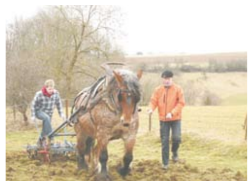
Un exemple de l'usage du cheval de trait comme outil de gestion écologique.

Terra Nostra : Le GAL permet clairement d'apporter un financement indispensable aux projets locaux. C'est d'ailleurs dans le cadre des « sites pilotes » impulsés par le GAL qu'ont pu être financées les plantations réalisées à l'automne, sur base d'ailleurs d'un inventaire des anciens vergers mené par l'asbl Les Bocages également dans le cadre du GAL... C'est aussi un interlocuteur privilégié, apportant une expertise en gestion de projet et gestion financière, ou donnant accès à de précieux inventaires comme celui sur les zones humides. En fait, nous considérons que notre action et celle du GAL sont très complémentaires. Notre proximité de terrain, notre capacité à mobiliser les agriculteurs ou à réaliser les aménagements permettent d'atteindre les objectifs que s'est fixé le GAL... Une belle symbiose en fait ! Par contre, nous soulignons la difficulté de travailler dans des conditions relativement précaires, la durée des projets du GAL étant fort limitée dans le temps, surtout à l'échelle de la nature.