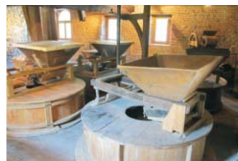
A découvrir, le Moulin à eau de Gerpinnes.

Lors de la dernière Assemblée générale du GAL en novembre, deux nouveaux partenaires ont rejoint le partenariat du GAL : l'asbl Moulin à Eau de Gerpinnes et l'asbl Terra Nostra. Le Moulin à Eau de Gerpinnes ayant déjà été présenté dans une précédente édition (voir Galopin n°17), nous ne pouvons qu'inviter les lecteurs à redécouvrir ce lieu unique offrant dans un bâtiment du 17ème siècle une machinerie complètement restaurée permettant de produire une excellente farine moulue sur pierre ou de l'électricité verte... La visite constitue une belle occasion d'aborder les questions très actuelles d'économie d'énergie et d'alimentation locale !