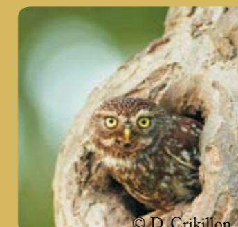
Chouette chevêche sur un vieux fruitier

Ce début d'année 2012 sera marqué, outre par l'évaluation de l'année 2011 (qui s'avère déjà fort positive !), par la poursuite des actions en cours et par la mise en route de nouveaux projets et de nouvelles actions dans des domaines variés.